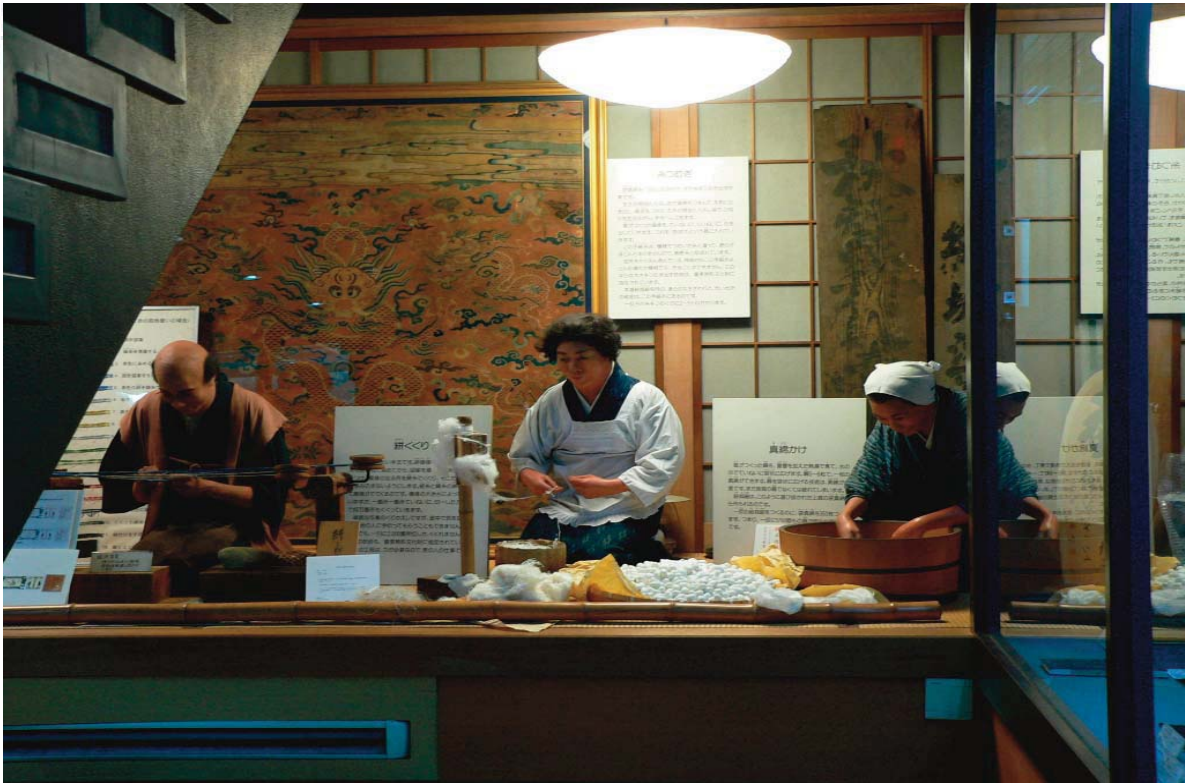
“Chọn sợi” ở làng dệt Yuki - Ảnh: Tác giả

vải Yuki - tsumugi vừa nỗ lực, linh hoạt trong cách quảng bá hình ảnh di sản của mình. Hình ảnh lá dâu tằm, con tằm - những biểu tượng gắn liền với nghề dệt vải Yuki - tsumugi đã được thấy trong các cửa hàng: treo, dán lên tường hoặc là hình ảnh trang trí của các loại bánh, kẹo truyền thống. Vải Yuki - tsumugi được bày bán không chỉ trong các cửa hàng bán vải, nhà trưng bày mà vào bất cứ quán cà phê, nhà hàng nào du khách đều có dịp được thưởng thức những tấm vải Yuki - tsumugi có chất lượng, hoặc cầm những quyển thực đơn trên tay, du khách cũng được nhìn thấy hình ảnh của vải Yuki- tsumugi (vải được sử dụng để làm bì bọc), làm các đồ quà lưu niệm (ví, dây đeo chìa khóa, móc điện thoại, khăn, calavat... Bằng cách làm như vậy, tài sản văn hóa quý giá này được thể hiện, giới thiệu với du khách trong mọi lúc, mọi nơi.